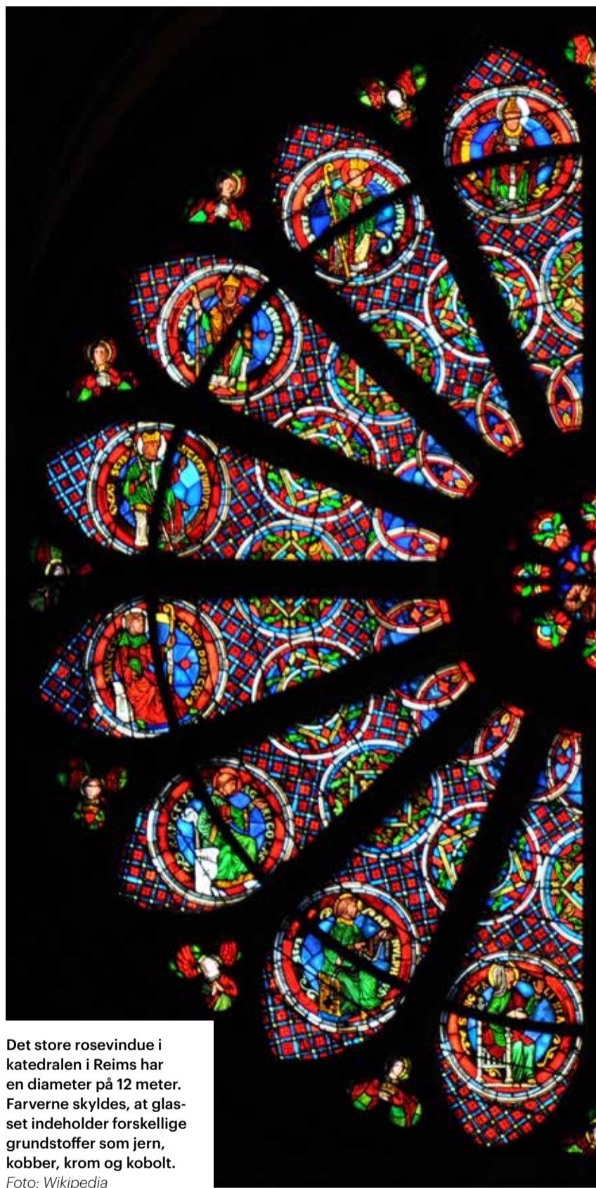
Det store rosevindue i katedralen i Reims har en diameter på 12 meter. Farverne skyldes, at glasset indeholder forskellige grundstoffer som jern, kobber, krom og kobolt.